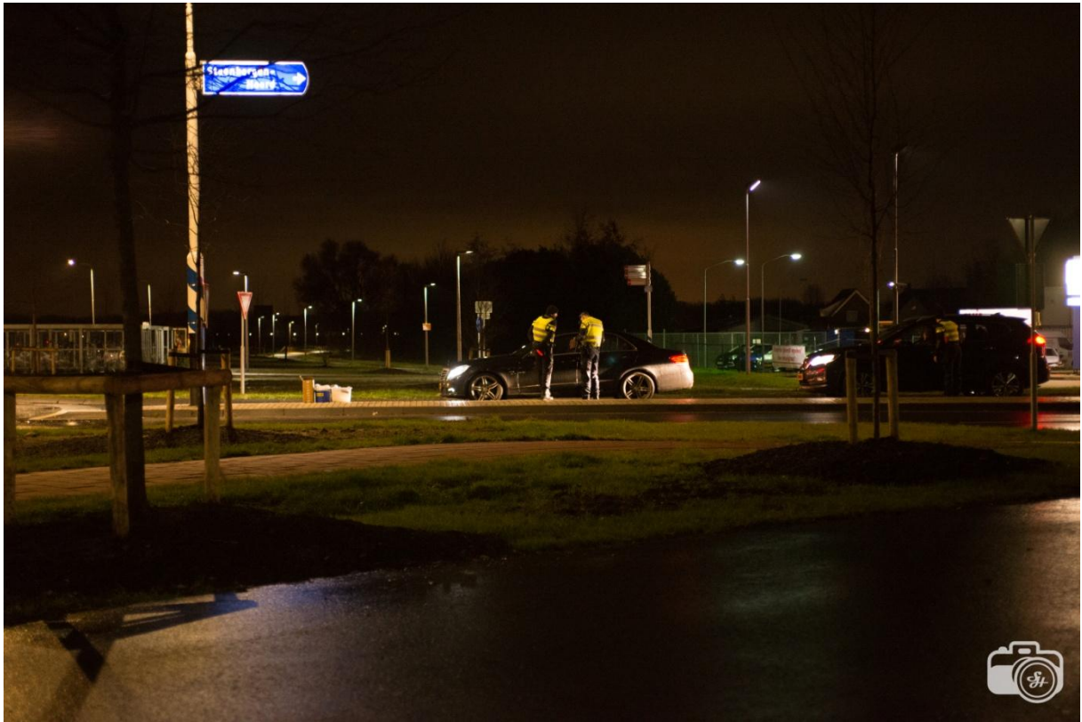
Buurtpreventie op ronde